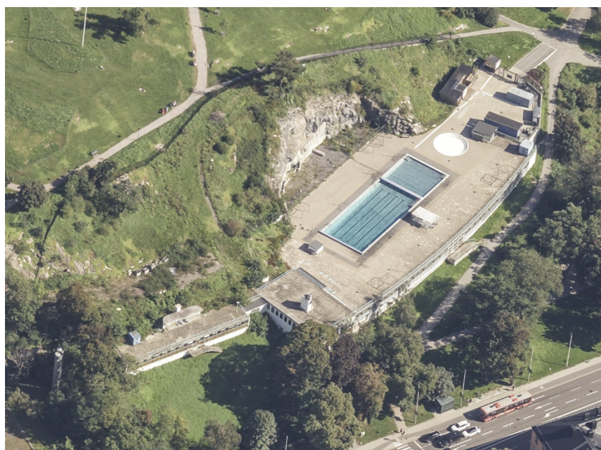
Vy över Vanadisbadet

Författare: Mathias Uhrner Rolf Forsman Sofie Larbom