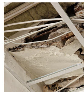
Bilaga 1: Utökad statuskontroll av konstruktör 2024

De tomställda lokalerna, för detta hotelldelarna, uppfyller inte idrottsförvaltningens behov och är därmed fortsatt tomställda. År 2024 fick exploateringsnämnden i samarbete med idrottsnämnden och fastighetsnämnden med flera, i uppdrag att ta fram en inriktning för Vanadisbadet och dess närområde. Under hösten 2024 utredde förvaltningarna byggnadernas skick och tekniska status inför kommande upprustning och modernisering. En kulturhistorisk förundersökning togs fram av Stadsmuseet. År 2025 framställde fastighetskontoret och idrottsförvaltningen en